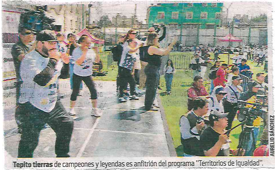
Tepito tierras de campeones y leyendas es anfitrión del programa "Territorios de Igualdad".