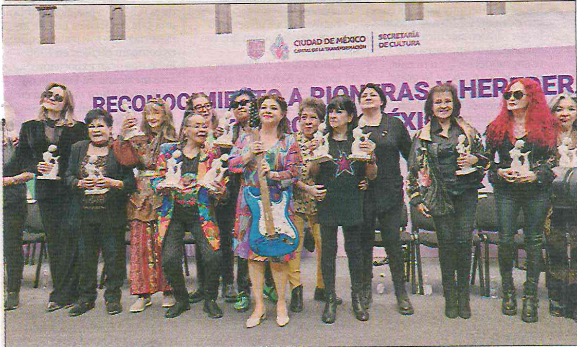
▲ En el concierto Sirenas al ataque se presentaron en el Monumento a la Revolución la banda Las Luz y Fuerza y Baby Bátiz, entre otras. A mediodía, la jefa de Gobierno Clara Brugada entregó reconocimientos a las pioneras de este género musical.