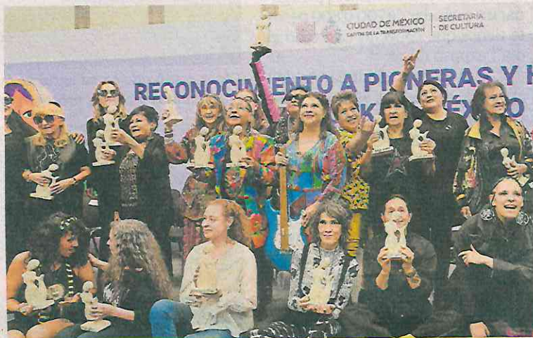
En el Museo de la Ciudad de México, la jefa de Gobierno, Clara Brugada, entregó reconocimientos a 44 exponentes del rock.

"Señora Presidenta, señora jefa de Gobierno, exigimos un cese