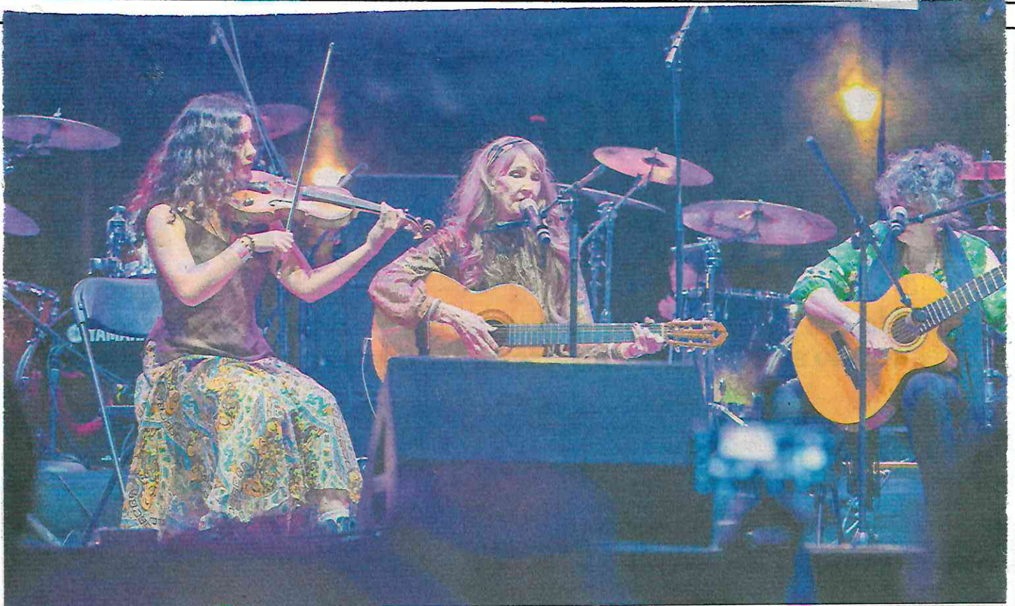
En la explanada del Monumento a la Revolución se homenajeó a las pioneras del rock mexicano, así como a representantes del año 2000.