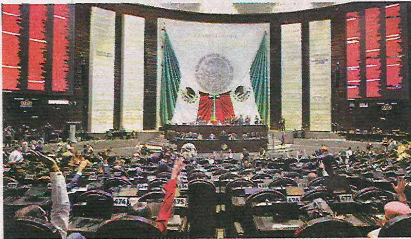
En 2024, la oposición desatendió la elección de legisladores. ARACELI LÓPEZ